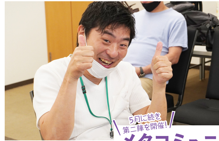
5月に続き 第二陣を開催!